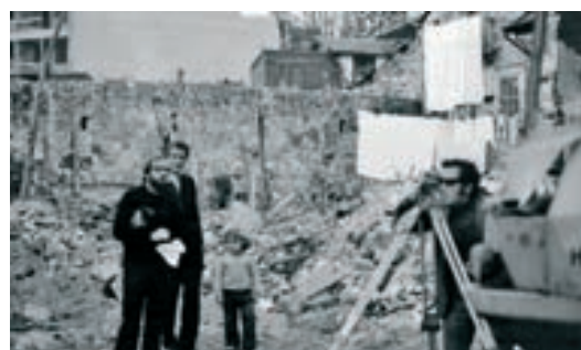
Siza em obra – Bouça 1974 Porto

Sobre essa inconclusiva Grandiosidade da Beleza , recorro a primeira vez que vi os "Os Escravos". de Michelangelo. Nestas estátuas inacabadas entende-se essa possibilidade da Beleza desde o bruto, desse o puro, numa certa clareza bela do processo da feitura, da poética da inteligência criadora. É "um processo" que reúne o que temos de maior valor poético, ético e social.