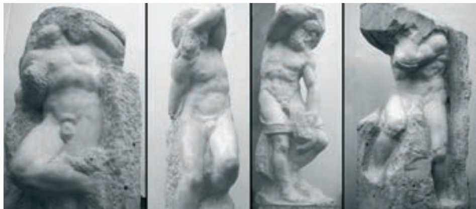
"Schiavi"La G.Academia de la Florencia Michelangelo Buonarroti

desde a consciência e alguma dependência do Global. A Pandemia e agora a guerra na Europa estão a provar esta evidente necessidade de uma aferição à escala dos problemas e respostas, que tudo e todos serão chamados a resolver, como a Arquitectura também; a reflectir, reavaliar, reinventar, a projectar.