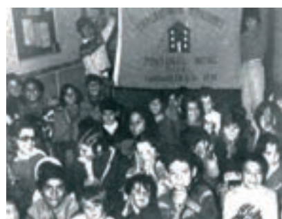
Reunião de projecto com cooperativa de moradores