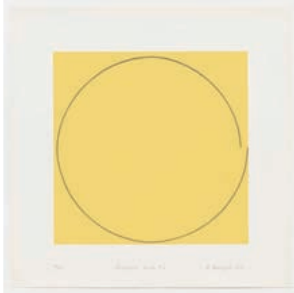
Imperfect Circle No. 2 (Yellow) 1973

compreensível, numa ambivalência própria da contemporaneidade: A Arquitectura pensa-se, desenha-se e organiza-se pela imagem do bom gosto comum.