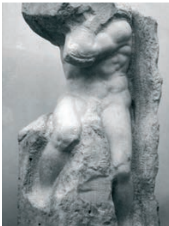
El Esclavo Atlante - La G.Academia de la Florencia

“Há homens que lutam um dia e são bons, há outros que lutam um ano e são melhores, há os que lutam muitos anos e são muito bons, mas há os que lutam toda a vida e estes são imprescindíveis.”