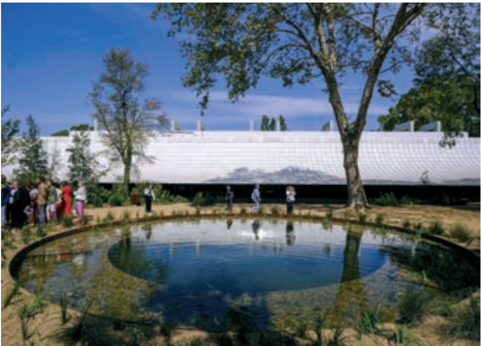
Figura 1 - Centro de Arte Moderna 1

Na arquitetura Venustas refere-se ao apelo visual, à estética, o que pode ser traduzido por beleza, pelo impacto que o edifício ou a construção tem nas pessoas e/ou utilizadores o acréscimo cultural ou mesmo acréscimo na valorização do edificado e da sua envolvente. A inclusão no património local assim como a experiência vivenciada pelas pessoas pode ser traduzida em impacto de beleza, harmonia, criatividade e inovação (M. Mehaffy & Salingaros, 2021).