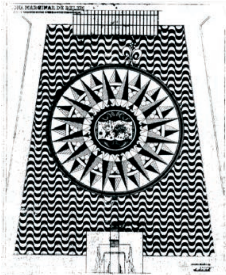
Figura 5 – Desenho do atelier de Luís Cristino da Silva. Desenho de conjunto Padrão dos descobrimentos e Rosa-dos-Ventos. Espólio Luís Cristino da Silva Cota Icsda 47.43 ic Biblioteca de Arte FCG 6

Há também a clara implicação de combinações ou simetrias compostas. A ligação da simetria de Vitrúvio ao conceito de harmonia também sugere um agrupamento de simetrias relacionadas (M. Mehaffy & Salingaros, 2021).