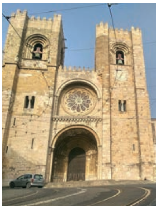
Figura 4 – Fachada da Sé de Lisboa 5

Na Igreja de São Domingos, também localizada no centro de Lisboa, embora as rosáceas não sejam tão imponentes quanto as da Sé, elas apresentam simetrias que podem ser descritas como cíclicas ou diédricas, dependendo do padrão específico. A simetria diedral, que articula simetria e rotação, é evidente nalguns padrões ornamentais das janelas. Essas rosáceas são típicas do estilo gótico, conhecido por seu uso de luz e profundidade, e são projetadas para evocar a ordem cósmica e a beleza divina, criando um ambiente de espiritualidade e harmonia por meio de padrões complexos e simétricos.