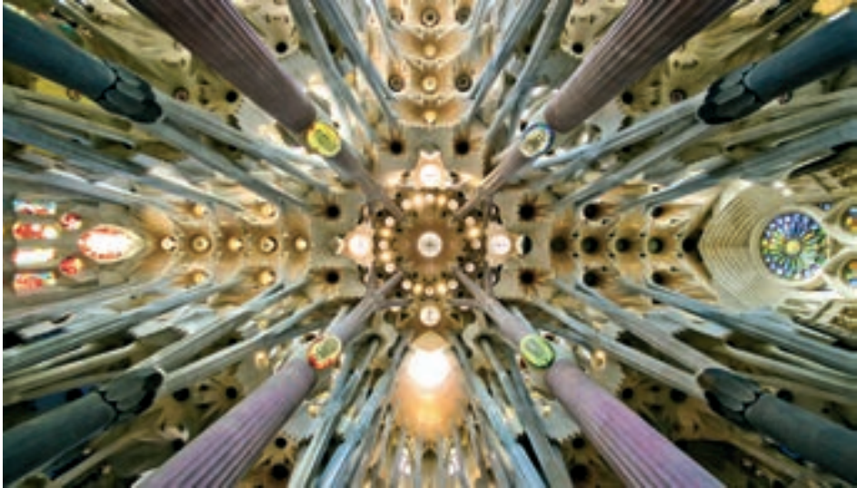
Figura 6 – Sagrada Família, do Arqº Antoni Gaudí, em Barcelona 7

construções, mas também pode informar decisões de projeto, ajudando arquitetos a criar formas que equilibram simplicidade e complexidade (Ostwald & Dawes, 2020).