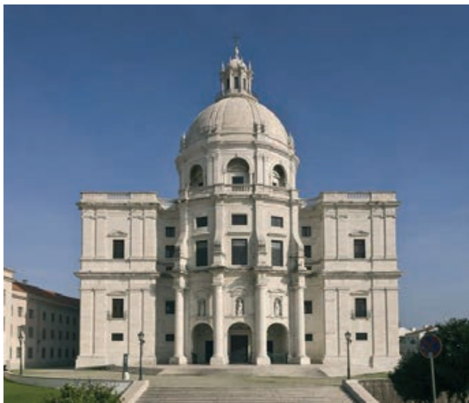
Figura 3 – Fachada do Panteão Nacional, também conhecido como a Igreja de Santa Engrácia do Arqº

A simetria vertical é bastante comum na arquitetura e, sempre, associada ao corpo humano. Mas o conceito é muito mais amplo, além da simetria reflexiva na geometria, há simetria rotacional, simetria translacional, simetria de escala e muitas composições (Lockwood, 1978).