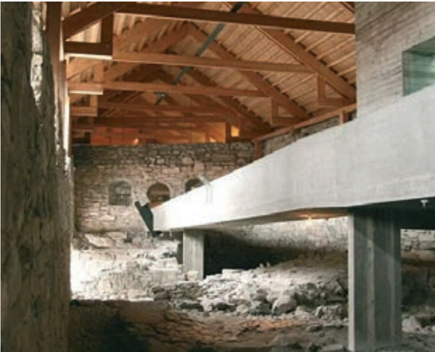
Fig. 5 - Anno Museum, Hamar, Noruega - fotográfico Frederik Garshol, visitnorway.com.