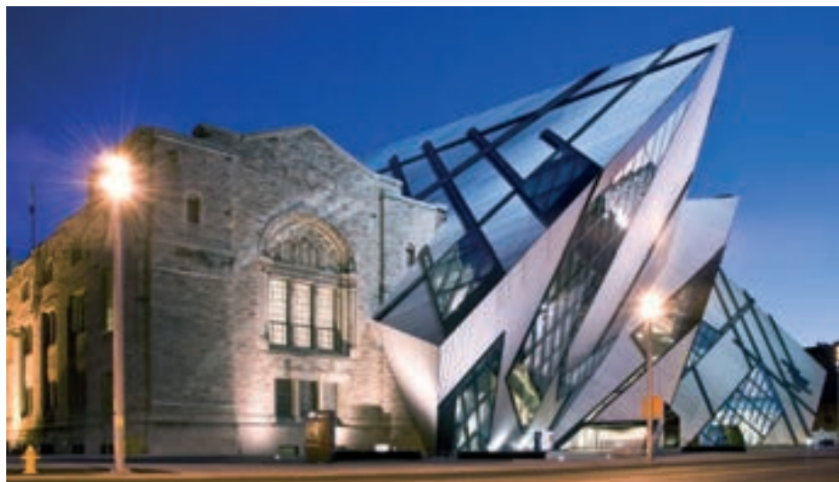
Fig. 1 - Museu de História Militar de Dresden, na Alemanha, construído entre 1873 e 187, em estilo neo-clássico, sendo revitalizado por Libeskind. Reabrindo ao público em 2011. Daniel Libeskind, O Desconstrutivista que provoca e emociona - publicado em 11 de setembro de 2019, por Agência Papoca. [documento icónico] disponível em https://laart.art.br/blog/daniel-libeskind/ . "O belo é sempre o inesperado".

Considero esencial que la arquitectura este enraizada en la historia, en la memoria y en la tradición de un lugar. Existe una conexión entre lo memorable y lo eterno. La arquitectura es construir hacia una dirección: debe mirar al futuro y adquirir sustancia dentro de la vida de las personas. (Libesking, 2006)