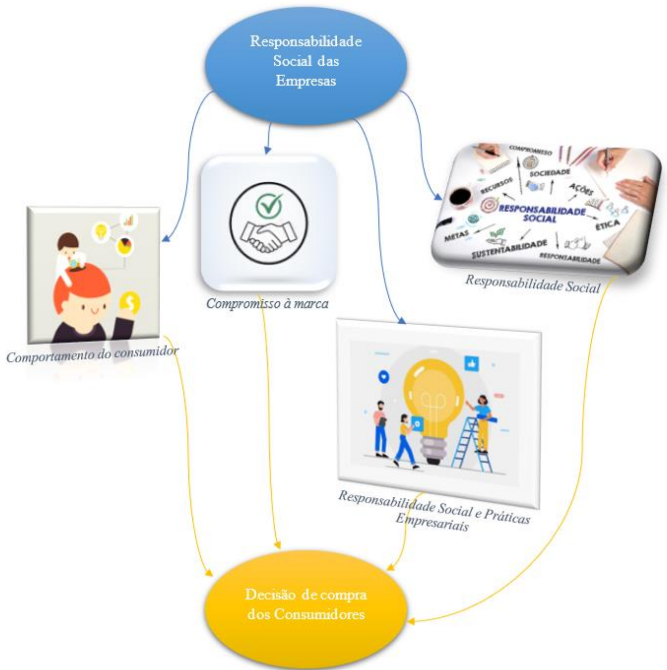
Figura 2 - Modelo Conceptual