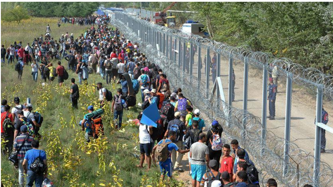
Fig. 2 – Hungria (migrantes forçados impedidos de entrar na fronteira do país)

decisiva na escolha dos migrantes forçados que deveriam permanecer ou abandonar o seu território, pelo que Orbán o via como uma medida ilegítima, considerando que os líderes europeus não possuíam autoridade para executar resoluções acerca das recentes migrações que previssem a sua aplicação num Estado, quando essa não era a vontade do mesmo (Orbán, 2015). À luz deste raciocínio, Szabolcs Takács, Secretário de Estado húngaro dos Assuntos Europeus, ressaltou também a desvinculação do país ao referido compromisso: “We will not accept any kind of compromise that includes the mandatory distribution of immigrants and asylum-seekers [...] Hungary has no legal or political obligation to become a country of immigrants” (Takács, 2018). Viktor Orbán acrescentou ainda que o sistema de quotas não seria um bom método para solucionar a crise, uma vez que em vez de manter os fluxos migratórios longe, funcionava como um convite para que viessem para o território europeu, o que propagava o terrorismo e fomentava a recriação de fronteiras internas dentro da UE como forma de os Estados providenciarem a sua própria segurança (Orbán, 2015a). Neste contexto, o modo de atuação húngaro face às migrações regia-se pelo princípio de “export help, not import problems” (Orbán, 2018), concebendo que a única solução viável era travar a vinda dos fluxos migratórios para a Europa e não arranjar uma forma eficaz de os gerir já dentro da EU. (Botelho, 2020, p. 38)