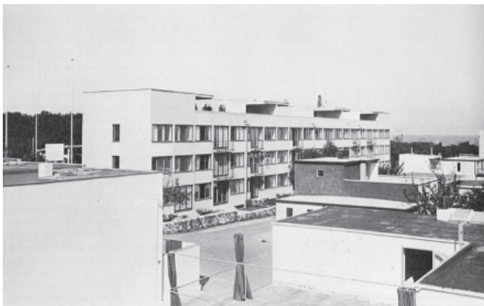
Edifício de Mies no Weißenhofsiedlung (fotografia de época in Mies Van Der Rohe , David Spaeth, Editorial Gustavo Gilli SA, Madrid 1985)