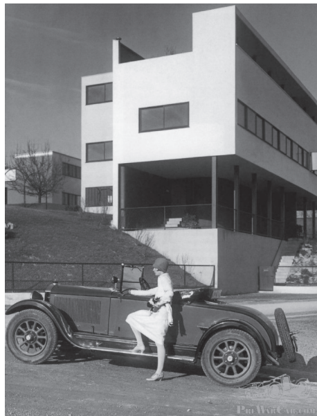
Le Corbusier Weissenhof