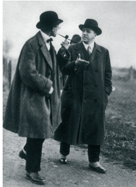
Fotografia de época in Mies Van Der Rohe , David Spaeth, Editorial Gustavo Gilli SA, Madrid 1985)

Sobre a direita na imagem, Ludwig Mies Van der Rohe, o responsável pelo plano e organização do moderno Bairro Weissenhof-Siedlung ( Weißenhofsiedlung ) nos arredores de Stuttgart em 1927. A ideia das entidades oficiais alemãs era mostrar ao mundo a vitalidade da sua cultura e a determinação da sua modernidade. Mies convidou um grupo de Arquitectos que se destacavam como protagonistas do movimento moderno europeu, entre os quais Charles Eduard Jeanneret aliás, Le Corbusier, ao seu lado esquerdo, que ilustra Mies a recebê-lo em visita à obra do bairro.