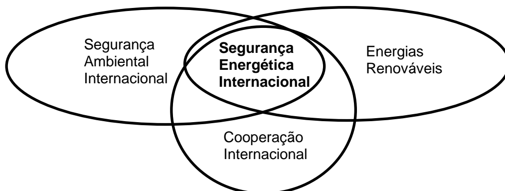
GRÁFICO 2: SEGURANÇA ENERGÉTICA INTERNACIONAL

A investigação escolheu alguns objetivos específicos. Analisar os fatores geradores das mudanças no clima. Identificar o impacto das alterações climáticas no âmbito da segurança ambiental nacional e internacional. Avaliar as energias renováveis enquanto recursos naturais supostamente “limpos” que contribuem para a preservação do meio ambiente. Explicar porque, e como, as energias renováveis são uma alternativa viável aos combustíveis fósseis, na medida em que também contribuem para a segurança ambiental. Fazer referência aos principais acordos internacionais nesta matéria, que possam servir de referência ao estudo em apreço. Estudar porque os países não conseguem resolver o problema sozinhos e procuram discutir, cada vez mais e em conjunto, em fóruns internacionais, temas relacionados com as alterações climáticas, a sustentabilidade e as energias renováveis, que têm impacto direto e indireto sobre a segurança ambiental, nacional, regional e mundial. Identificar, de acordo com o conhecimento científico disponível no presente, quais os principais cenários, riscos e políticas globais no âmbito das alterações climáticas.