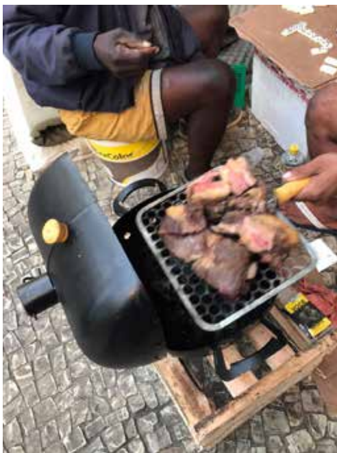
Figura1: a vida privada no espaço público