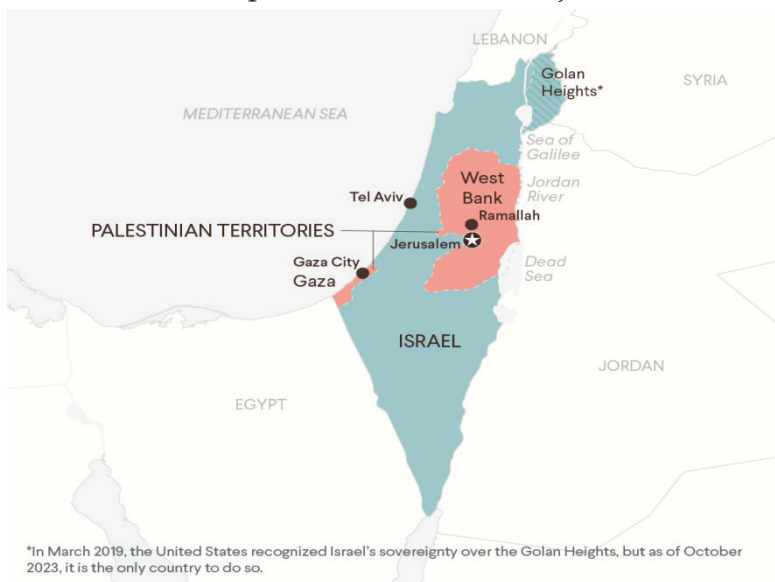
Figura 3 - A território atual.