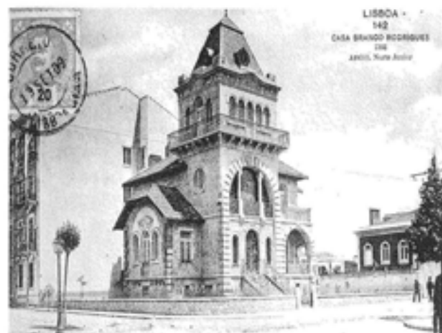
Casa Branco Rodrigues – Arq. Norte Júnior

As origens deste modelo remontam à antiga discussão da «Casa Portuguesa» do final do século passado, campanha que tivera início na corrente de raiz nacionalista, de afirmação dos valores nacionais, («a nova geração de 90», nas palavras de J. A. França) em reacção à crise gerada pelo “Ultimatum” de 1891 e à importação indiscriminada de modelos