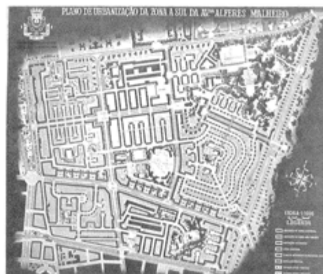
Plano de Alvalade