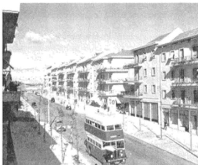
Av. João XXI - Plano de Alvalade

Em termos funcionais, a organização interna desta “casa” assenta numa distribuição hierarquizada à semelhança do que acontece com o conceito de família, através da atribuição de funções específicas aos compartimentos, reforçada pelo mobiliário com que por vezes se equipam estes fogos, em particular nos programas de “Casas Desmontáveis”. Esta especializa-