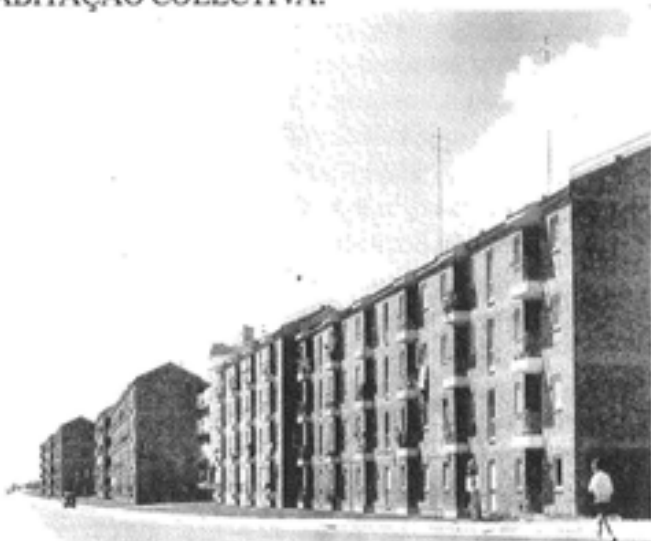
Blocos de Habitação em Olivais Norte

Na procura de soluções para a questão habitacional, a Administração Central em colaboração com as câmaras municipais, toma uma atitude pragmática. Esta vai passar pelo abandono do tipo de habitação unifamiliar e pela adopção do tipo de habitação plurifamiliar, o bloco colectivo de habitação , como forma de responder eficazmente às necessi-