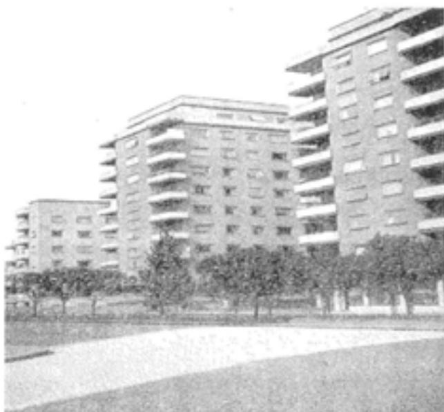
Blocos de Habitação em Estocolmo

Para o financiamento das suas operações, a C.M.L. continuou a apoiar-se nas suas fontes tradicionais de financiamento, a Caixa Geral de Depósitos, o Fundo de Desemprego e a Federação de Caixas de Previdência embora nos anos 50 estes financiamentos tenham sofrido alguns condicionalismos decorrentes do contexto nacional emergente.