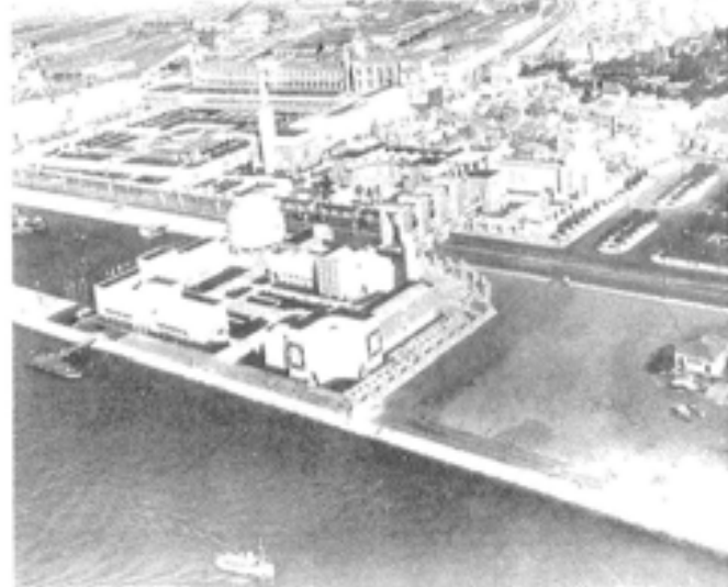
Exposição do Mundo Português - 1940

- num discurso social , enquanto discurso que realça a importância da família na organização da sociedade portuguesa. Para o regime, é fundamental a defesa da família e dos valores a ela associados, como garante do desenvolvimento do modelo de sociedade que preconiza, pelo que o “Estado” se impõe a obrigação de criar as condições necessárias ao seu “desenvolvimento harmonioso”;