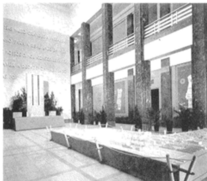
Exposição de Obras Públicas - LS/T, 1948

mente de carácter económico, demonstrando uma atitude essencialmente pragmática de ataque à dimensão da questão habitacional, que relega para segundo plano as preocupações expressas no discurso ideológico sobre a habitação do período antecedente.