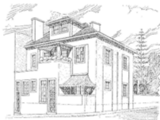
"Casa em Lisboa" Arq. Raul Lino

privilegiado de afirmação de um discurso ideológico evocativo dos "valores fundamentais da Nação", a «casa da família» assume-se como a sua "representação física", como aliás parece decorrer da teorização da «Casa Portuguesa». O TIPO DE HABITAÇÃO UNIFAMILIAR: