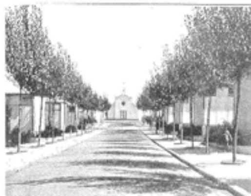
Bairro Quinta da Calçada - Casas Desmontáveis, 1941

Com base nestes conceitos, o regime promoveu fundamentalmente dois tipos de habitação; o tipo de habitação unifamiliar , que corresponde à moradia (isolada ou em banda) e o tipo do bloco colectivo de habitação . Esta evolução corresponde a dois períodos distintos da vida do regime, muito embora, em termos ideológicos, permaneçam constantes algumas características