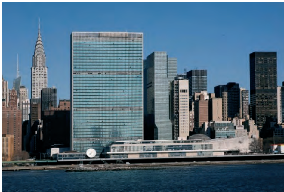
Ilustração 1 – Construção em altura associada ao poder e ao capitalismo Sede da Organização das Nações Unidas, em Nova Iorque

mem descobre as estruturas do mundo. A arte da luz assume-se como linguagem do homem, enquanto o silencio da sombra é o significado de uma vida infinita. Portanto, a ordem do desenho arquitetônico é o resultado da sombra-luz em confronto com o silêncio. Le Corbusier fala da fragmentação do objeto, numa atitude de linhas e de vazio fazem parte de uma tendência e de uma filosofia para diversas interrogações da formalização do objeto, estão relacionadas com as novas teorias das ciências físicas, que se debruçam sobre a decomposição da matéria em partículas e espaço, e a interação entre a matéria e a luz.