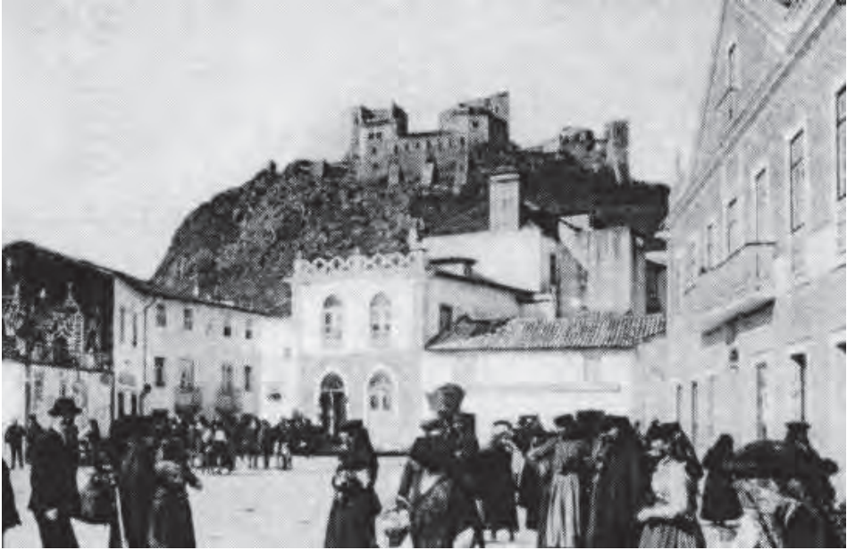
Castelo de Leiria antes da intervenção no final do séc. XIX (extracto de postal antigo).