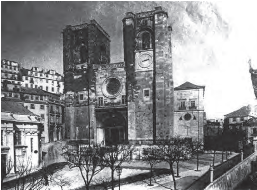
Sé de Lisboa. Fachada principal, princípios do século XX, foto p.b..