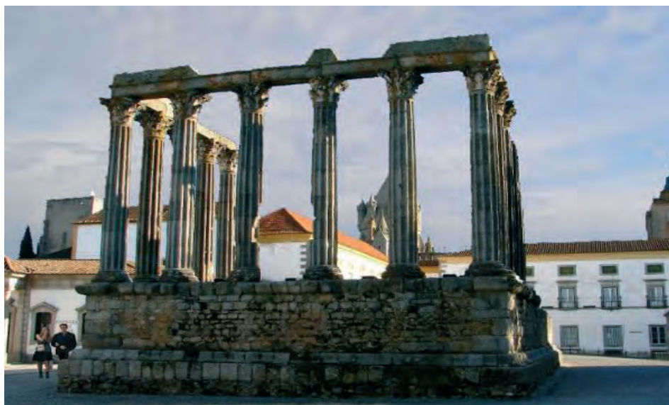
Templo de Diana, Évora (ilustração nossa, 2009)

Importa relembrar que o Alvará de D. João V, em vigor, comprometia explicitamente a noção de “monumentos antigos” a épocas muito definidas, excluindo, entre outros, os edifícios conventuais construídos ao longo da Idade Média e criando assim um vazio legislativo que não terá por certo travado a degradação acelerada a que os monumentos estavam votados. Muitos conventos foram entregues ao exército, passando outros para funções fabris, escolas, hospitais, armazéns, etc.. Desta acção decorreram óbvias campanhas de adaptação funcional dos espaços as quais, regra geral, puseram irreversivelmente em causa testemunhos patrimoniais e artísticos do passado.