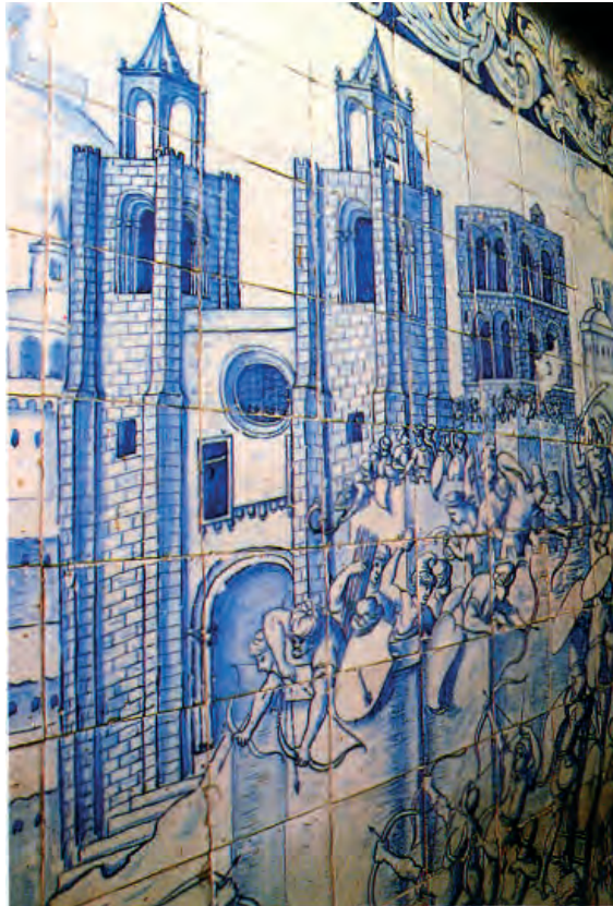
Sé de Lisboa. Aspecto da Sé de Lisboa na primeira metade do século XVIII. Fragmento de um lambril de azulejos existente na portaria do Mosteiro de S. Vicente de Fora (MOTA, Irisalva (coord.) (1994) - O Livro de Lisboa. Lisboa: Livros Horizonte. P. 123).

elementos que não se enquadram no estilo românico ou gótico, referindo, como exemplo, que a Sé se encontrava «coberta de horríveis estuques que a mascaravam ridiculamente de estilo clássico (...)» (FUSCHINI, 1904: 142) ou que os coruchéus primitivos «(...) não tiveram a detestável forma com que aparecem, em gravuras e azulejos posteriores ao século XV (...)» (FUSCHINI, loc. cit.). Custódio relembra que para o programa de operações de Fuschini «Importava privilegiar a aparência exterior do edifício, procurando na informação iconográfica as soluções que garantiam a sua reposição na situação originária do tempo medieval» (CUSTÓDIO, op. cit.: 52).