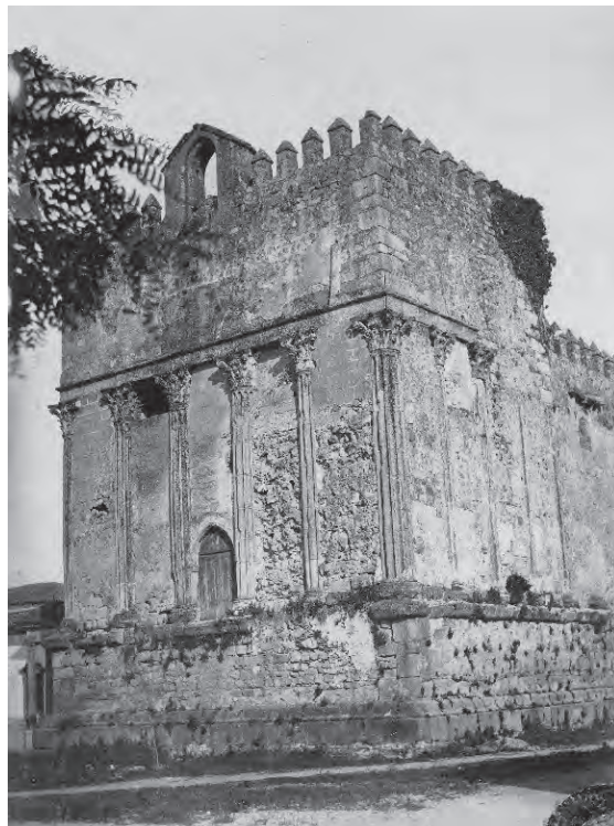
Templo de Diana, Évora, 1939.