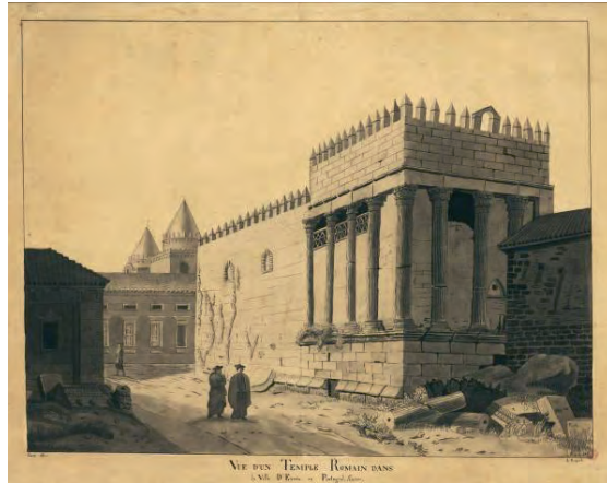
Templo de Diana, Évora, 1850 - Vue d'un Temple Romain dans la ville d'Évora en Portugal, A. Dupont, desenho tinta da china com aguadas (Biblioteca Nacional de Portugal. http://purl.pt/1241 )