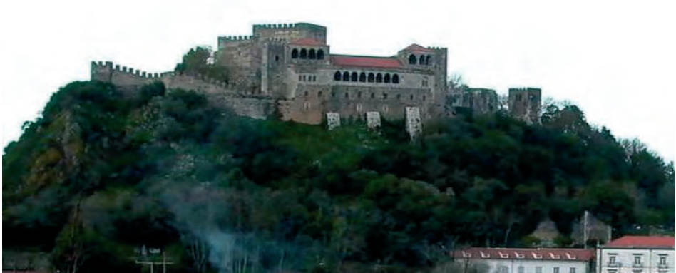
Castelo de Leiria na actualidade, mostrando os frutos das campanhas das correntes restauradoras da 1ª metade do séc. XX (ilustração nossa, 2003).

Em época de confrontação das várias teorias do restauro pelo resto da Europa, também em Portugal se levantavam vozes ressaltando alguns perigos do restauro integral defendido por Viollet-le-Duc. Gabriel Pereira (1847-1911) cumpriu um papel principal nessa acção defendendo a validade das questões levantadas por Camilo Boito em 1893 (é melhor consolidar que reparar, melhor reparar que restaurar). A lucidez