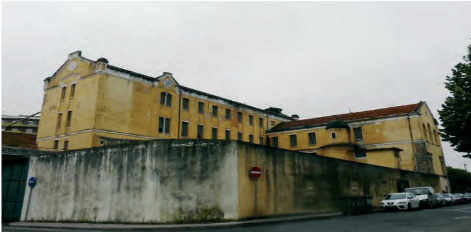
Convento de São Francisco – Companhia Leiriense de Moagem (ilustração nossa, 2010).