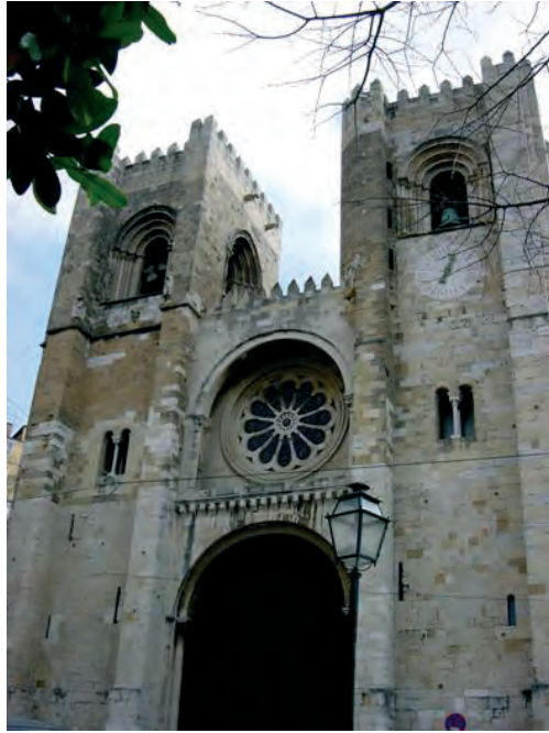
Sé de Lisboa. Fachada principal (ilustração nossa, 2003).