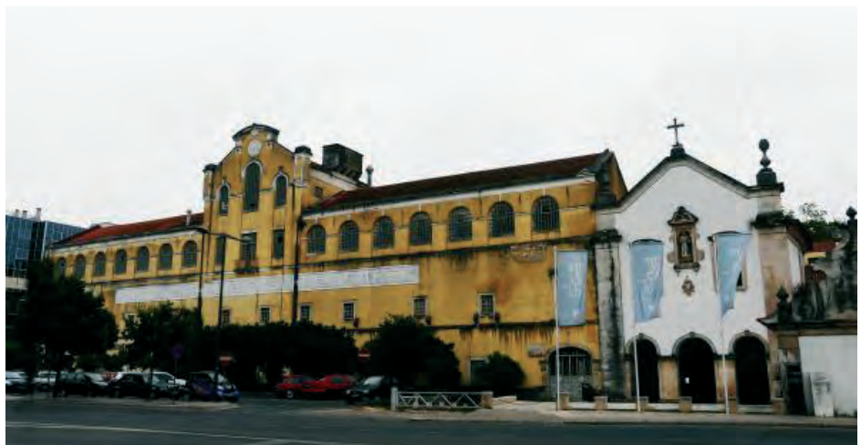
Convento de São Francisco, Leiria – Companhia Leiriense de Moagem (ilustração nossa, 2010).

Em 1880, a Real Associação dos Arquitectos Civis e Arqueólogos Portugueses, cumprindo um pedido do Ministro das Obras Públicas, apresentava a primeira relação de edifícios a classificar como Monumentos Nacionais. Agrupava-os em seis classes, abrangendo as obras-primas da arquitectura e da arte portuguesas, os edifícios com significado para o estudo da história das artes, os monumentos militares, a estatuária, os padrões e arcos comemorativos, bem como os monumentos pré-his-