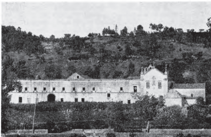
LEIRIA — Frontaria do Convento de S. Francisco antes da construção da Fábrica de Moagem

surgindo, no entanto, acções que revelam que o destino da herança cultural, que se apresentava sob a forma de património, deveria ser analisado do ponto de vista da ciência histórica. Os levantamentos e os cadastros começam a recair sobre os monumentos, intervindo já a fotografia moderna 8 como método científico auxiliar de grande importância para o delinear de projectos de restauro, conservação ou recuperação das ruínas arquitectónicas e arqueológicas do país.