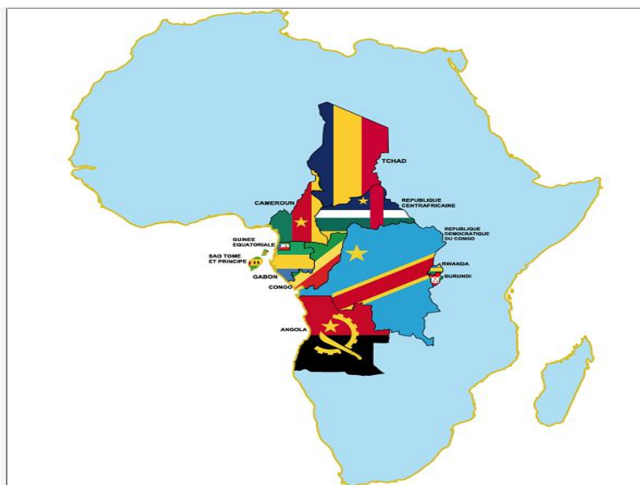
Ilustração 1 - Demarcação da África Central. (UNOCA, 2022).

O presente capítulo foi concebido com objetivo de procedermos ao enquadramento teórico do tema em estudo, tendo em atenção os conflitos da AC e a CEEAC.