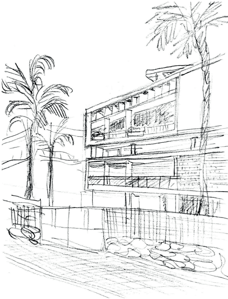
Moradia Modernista Alfredo Gago Rosa, (ilustração nossa)

Este ponto, também se revela importante pois procura uma relação da tradição com o modernismo. O modo como a tradição pode ser transposta para o modernismo tanto na prática como no conceito. Pois a tradição não tem de ser necessariamente algo material, pode ser também de resposta antropológica. Portanto, esta transição para o modernismo foi de extrema importância. O arquitecto deixa de estar em conflito consigo mesmo e com as suas origens.