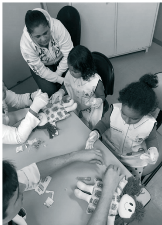
Enfermeiras-BT-Crianças e mãe apreciando.

Assim, essa atitude da enfermeira propicia que a onipotência ilusória necessária se manifeste na criança enquanto brinca (BT de algum tipo) e isto lhe assegura sentimentos elevados de autoestima, pois a criança que estava passiva, enferma, passa a ser a protagonista da experiência, situação que lhe devolve a confiança para os desafios que estão logo ali... A doença, o tratamento e procedimentos invasivos.