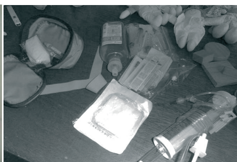
Curso Pós-Grad. UNIFESP.