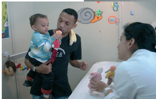
Centro Assistencial Cruz de Malta.