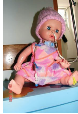
Hospital Darcy Vargas. São Paulo, Brasil, 2005.

No Brasil, referindo-se ao brincar na enfermagem, destaca-se o guia de ensino de enfermagem pediátrica (Moraes, 1972), no qual há a proposta de seu ensino e utilização do brinquedo na assistência de enfermagem à criança; e ainda, os artigos publicados de mesma autoria, que narram as experiências de graduandos de enfermagem, ao cuidar de crianças hospitalizadas utilizando o BT, denominado na época de “entrevista com brincadeira” (Moraes, Correa, Gabriel, & Castilho, 1979).