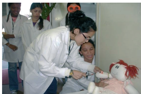
Centro Assistencial Cruz de Malta.

O Instrucional – para aprender sobre um procedimento ou evento do hospital, como deverá agir e como se sentirá no momento real; e, para esclarecer conceitos errôneos e expressar sentimentos.