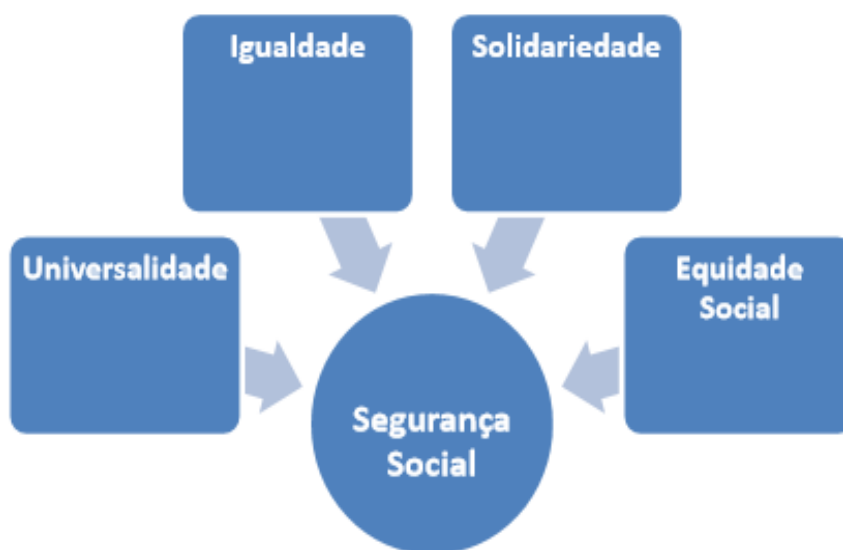
Ilustração 2 - Princípios da Segurança Social. (Ilustração nossa, 2021).

A Segurança Social é um sistema destinado a todos os indivíduos, guiado pelos princípios da universalidade, igualdade, solidariedade e equidade social (Lei de Bases da Seg. Social, Lei Nº 4; 2007).