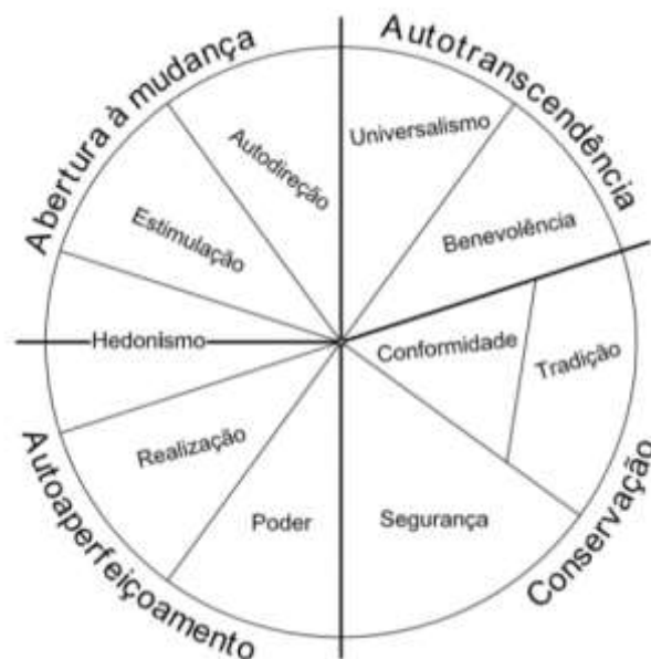
Figura 1. Círculo motivacional continuum . Adaptado de Schwartz (2012).

Segundo Rokeach (1973), é pouco provável que uma determinada situação ative apenas um único valor. A maioria das situações envolve o conflito entre diversos valores, cuja resolução estará de acordo com as prioridades de valores de cada um. Assim, o sistema de valores, mais do que um valor individual, proporciona um maior entendimento das forças motivacionais que conduzem às crenças, atitudes e comportamentos do indivíduo.