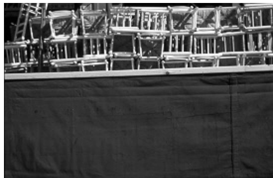
Sevilla. Semana Santa