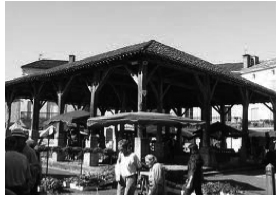
Belvès. França 2008. Mercado do séc. XVI utilizado como feira de degustação de produtos gastronómicos

melha (ícone de tal forma valorizado que, por vezes, é identificado com a própria festa, como a cerimónia de entrega dos Óscares em Hollywood ou carregado de significado simbólico como aconteceu no incidente ocorrido em Coimbra nos anos 60 quando os estudantes retiraram do chão as capas à passagem do Presidente do Conselho de Ministros em manifesto sinal de protesto).