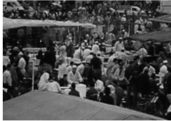
Marraquexe (Marrocos) praça Djemaa el Fna

outras. Mas o que aqui predomina é a adaptação da festa ao espaço existente, através da utilização de elementos efémeros. Todas as ruas ficam mais fechadas; toda a vila se unifica, envolvendo e encerrando os espaços a céu aberto numa densa profusão de cores. Temporariamente o mundo confina-se à vila.