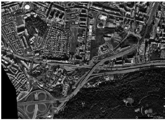
Figura 1 – Zonas de fronteira ou de continuidade?