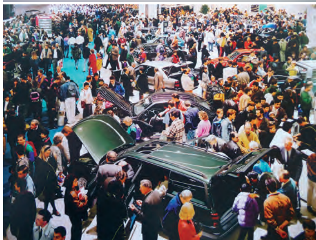
Ilustração 01 – GURSKY, Andreas, “Engadin”, 1995 Ilustração 02 – GURSKY, Andreas, “Autosalon, Paris”, 1993

“No cyber - espaço, toda a gente é ao mesmo tempo crítica e acrítica. A conversa sobre arquitectura prolifera, na maioria das vezes na ausência da própria arquitectura.”