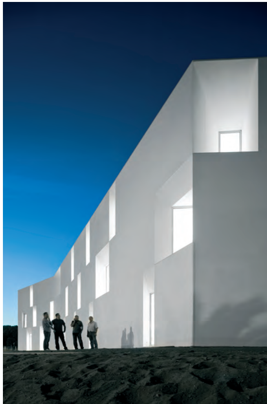
Ilustração 05 – GUERRA, Fernando, Lar de Idosos, Alcácer do Sal, Portugal, Aires Mateus, 2011

“A sedução remove o significado do discurso e destitui-o da sua própria verdade, tentando encantar o espectador a um nível meramente visual e impedindo assim uma apreciação mais profunda.” (LEACH, Neil, “ A Anestésica da Arquitectura ”, Lisboa: Antígona, 2005, pp.127)