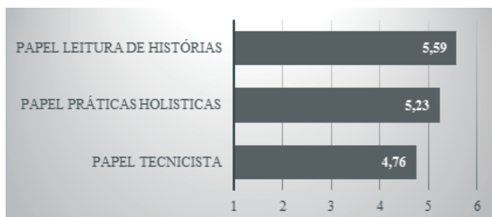
Gráfico 3 - Médias das dimensões da importância que os pais atribuem ao seu papel no processo de aprendizagem da leitura e da escrita

O papel leitura de histórias obteve a média mais alta, sendo por isso aquele a que os pais atribuem mais importância. O papel práticas holísticas aparece em segundo lugar e o papel técnico obteve a média inferior (Gráfico 3). As diferenças entre as três médias foram estatisticamente significativas [ F(2, 580)=149.54, p<.001 ], os testes post hoc mostraram diferenças significativas entre todas elas ( p<.001 ).