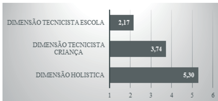
Gráfico 2 - Médias das dimensões das crenças dos pais sobre o processo de aprendizagem da leitura e escrita

As crenças holísticas obtiveram uma média superior às tecnicistas-criança, sendo ambas superiores às tecnicistas-escola (Gráfico 2). As diferenças entre as três médias foram estatisticamente significativas [ F(2, 580)=770.07, p<.001 ], os testes post hoc mostraram diferenças significativas entre todas as médias ( p<.001 ).