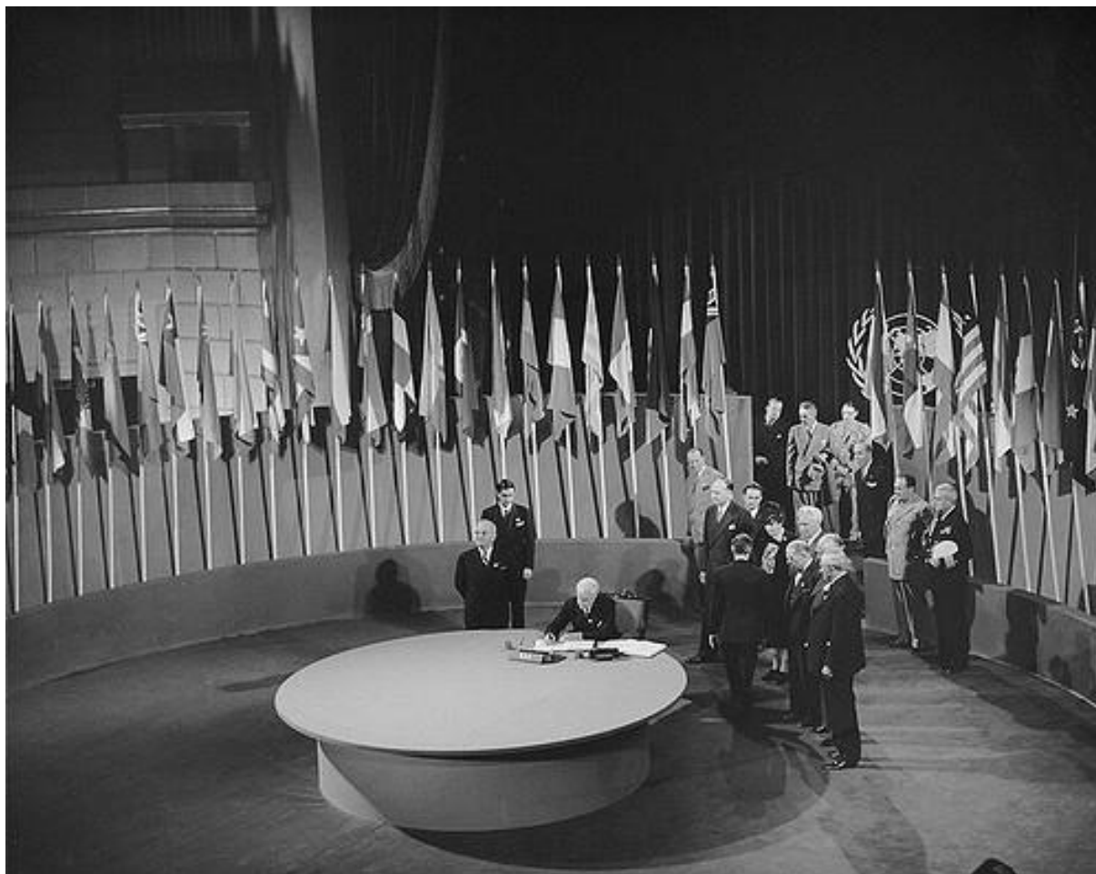
Figura 1 - UN Photo/Yould. (1945). The San Francisco Conference: The United States Signs United Nations Charter.

da ONU foi estabelecida em Nova Iorque e não em Genebra, devido à ligação à extinta SDN. (Saraiva et al, 2013).