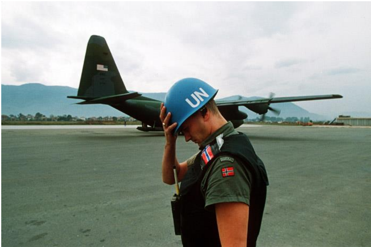
Figura 4 - Mikhail Evstafiev. (1992). A United Nations peacekeeper from Norway holds his helmet as a Hercules C-130 transport plane lands at Sarajevo airport in the summer of 1992.

num terceiro momento, foram monitorizados os acordos de cessar-fogo e realizados os procedimentos habituais num contexto pós-guerra, nomeadamente o trabalho de reconstrução do status jurídico e institucional dos estados afetados pelos conflitos, com o objetivo de consolidar a paz, bem como suportar e auxiliar a nova ordem institucional e financeira (Nascimento, 2007).