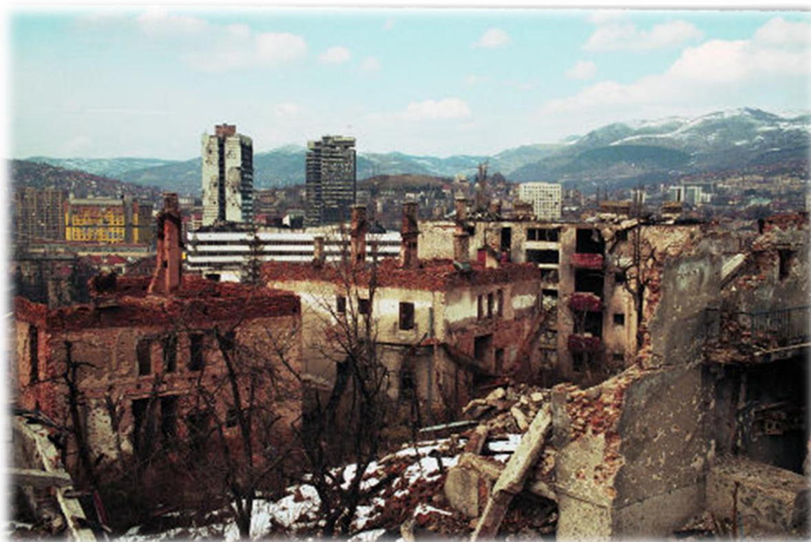
Figura 5 - Panorama da destruição da cidade de Sarajevo em março de 1996.

Neste sentido, além da violência atroz constante, também a escassez de recursos vitais, tais como água e comida, em consequência da estagnação económica, foram responsáveis pelo número de vítimas e refugiados considerado.