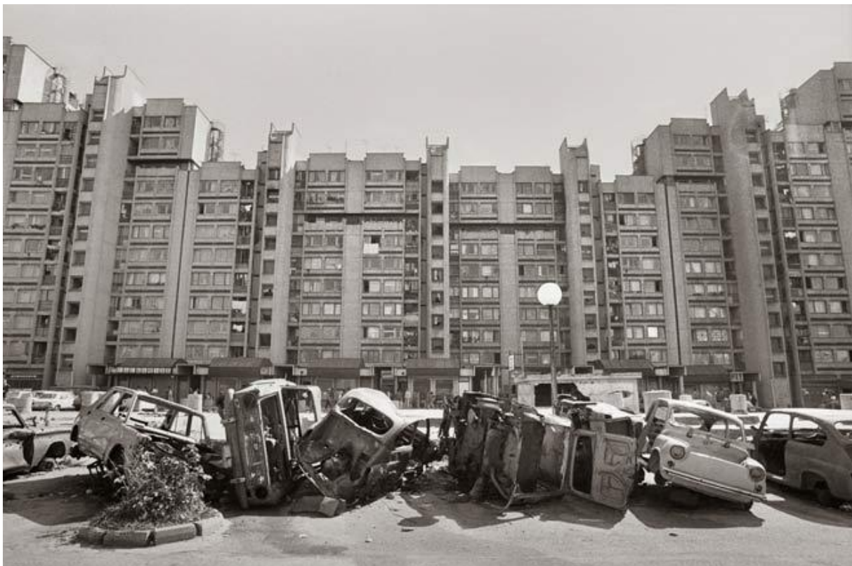
Figura 2 - Gervasio Sánchez. (1993). Coches aparcados en batería . Sarajevo.

Com efeito, a guerra da Bósnia-Herzegovina caracterizou-se pelos confrontos diretos e extremamente violentos entre as diversas etnias. Os membros pertencentes à etnia sérvia, apoiados pelo Exército Nacional Jugoslavo, combatiam as forças bósnias e croatas que, por sua vez, combatiam igualmente entre si, sem existir distinção entre militares e civis. Durante este período negro importa destacar o cerco de Sarajevo. De facto, a capital da Bósnia-Herzegovina encontrou-se cercada desde o dia 5 de Abril de 1992 a 29 de Fevereiro de 1996, sendo considerado o maior cerco a uma capital, na história militar contemporânea. Bombardeamentos constantes e escassez de recursos vitais, tais como água e comida, fizeram, efetivamente, parte do dia-a-dia da população durante todo o cerco (Mello Valença, 2006).