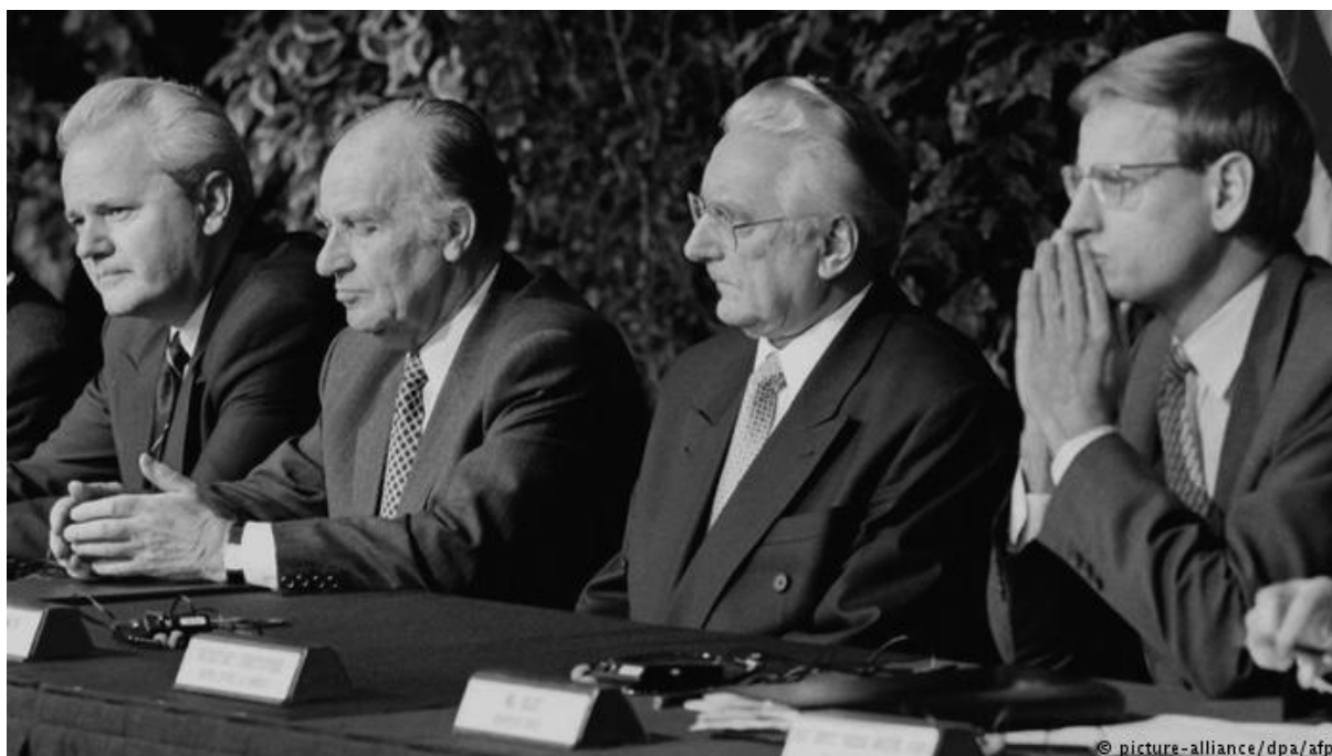
Figura 3 - Picture-Alliance. (1995). Os presidentes Milošević, da Sérvia, Izetbegović, da Bósnia-Herzegovina, Tuđman, da Croácia, e o negociador da UE, em Dayton.

Por conseguinte, o acordo de Dayton acaba por reconhecer as nacionalidades bósnia, croata e sérvia, bem como os seus respetivos idiomas, sendo, portanto, reconhecida a diversidade étnica e cultural presente no território. As restantes minorias nacionais, ou os filhos de casamentos mistos, não são considerados como sendo membros de um grupo em específico, no entanto, os direitos sociais, culturais e políticos acabam por depender diretamente da inclusão do indivíduo numa das duas entidades estabelecidas pelo acordo em questão, motivo pelo qual, e para se ser cidadão da Bósnia-Herzegovina, é indispensável que o indivíduo possua uma nacionalidade específica e habite numa das duas entidades referidas (Peres, 2013).