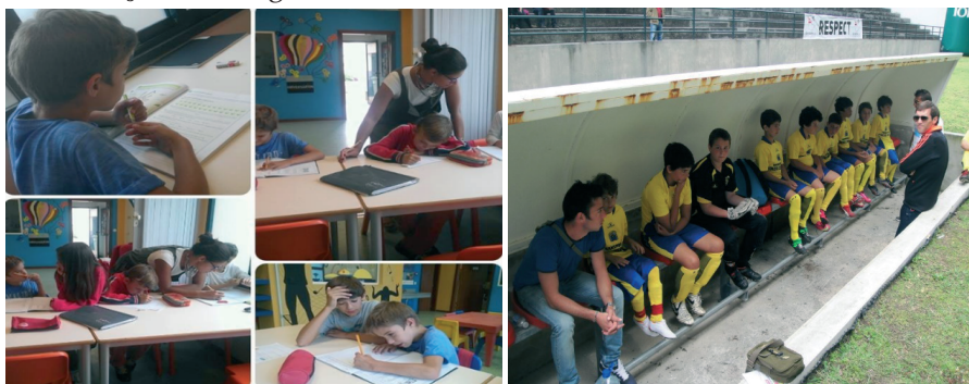
Ilustração 2 – Imagens da atividade ‘Escolinha social de futebol de rua’

No decorrer do projeto participaram 192 crianças e jovens na ‘Escolinha Social de Futebol de Rua’. Aliando os resultados escolares das crianças com a titularidade nos jogos e intercâmbios sociodesportivos e nos torneios comunitários, foi possível verificar uma evolução e mudança positiva dos participantes e da comunidade em geral, comprovada pela redução das situações de exposição a comportamentos de risco, abandono, absentismo e insucesso escolar, tal como a melhoria das competências pessoais e sociais. O sucesso educativo dos participantes aumentou quer a nível dos resultados, quer na