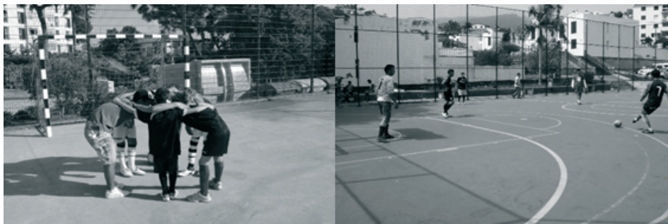
Ilustração 3 - Imagens da participação no ‘Torneio Regional de Futebol de rua da Madeira’

Até ao final de 2015 participaram 104 jovens e adultos no torneio regional de Futebol de Rua. A atividade destina-se a jovens e adultos em situação de