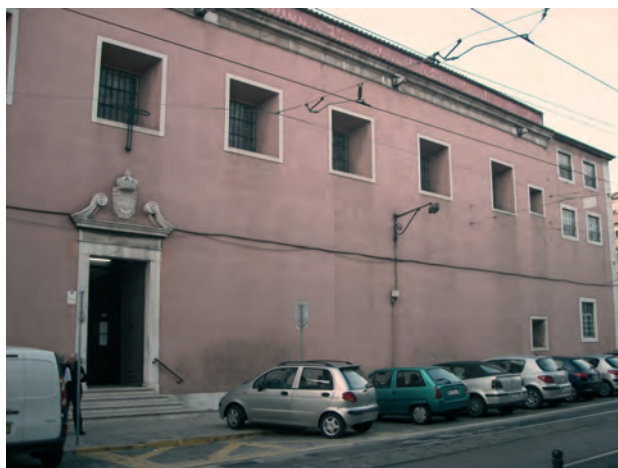
Foto 1 - Igreja de Nossa Senhora da Quietação

Iniciou-se a construção no ano de 1582, segundo projecto e traça do Arquitecto Régio Nicolau de Frias, o qual foi continuado por seu filho, Teodósio de Frias, por mandado de Filipe I de Portugal, com o fim de albergar as religiosas clarissas flamengas, vindas, precipitadamente, para o nosso país, em virtude das perseguições protestantes na Holanda 3 .