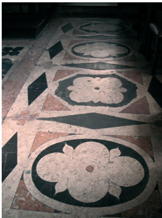
Foto 10 - Chão policromo de mármore

Do lado direito acha-se a entrada para a sacristia de planta quadrangular, com pavimento de embutidos de mármore policromo, tecto de madeira plano.