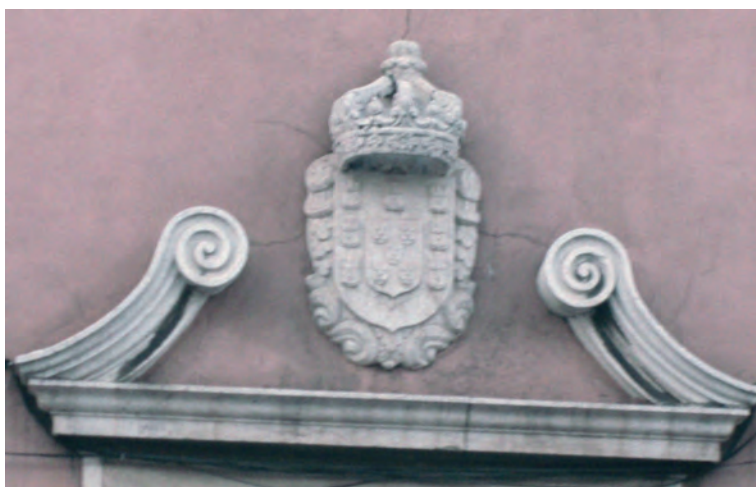
Foto 4 - Pormenor