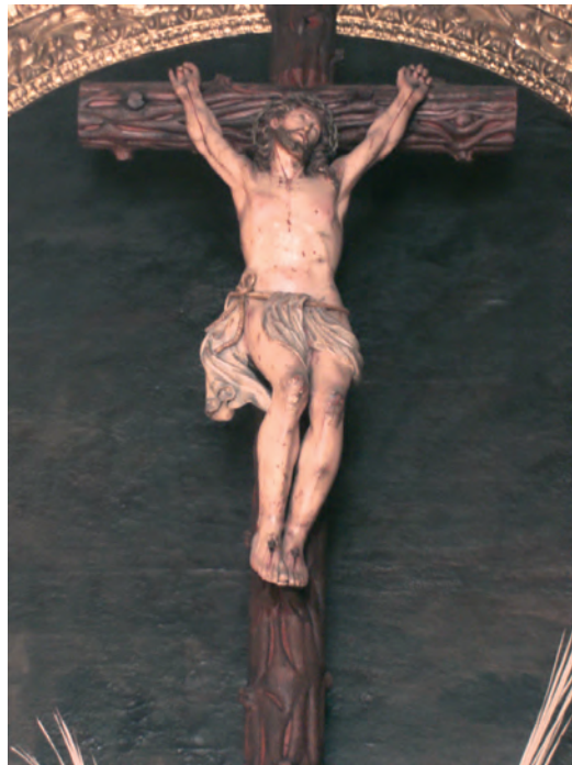
Foto 12 - Cristo crucificado que se encontra no interior da sacristia

Na parede central observa-se um magnífico crucifixo, assim como dois arcazes de pau preto de notável obra indo-portuguesa e oito telas, trabalho atribuído a Pedro Alexandrino.