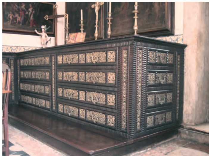
Foto 13 - Arcazes em pau-preto, no interior da sacristia