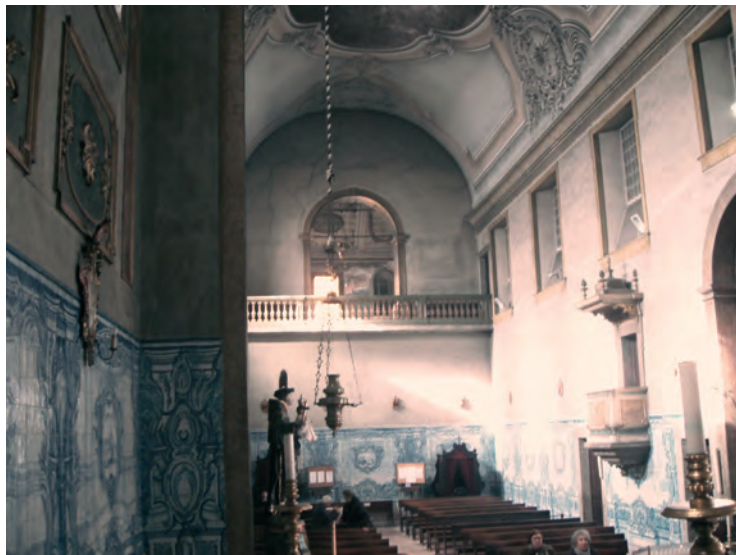
Foto 14 - Vista da nave, púlpito e coro alto

O coro, amplo espaço com magnífico cadeiral, possui tecto de madeira, dividido em painéis, com frisos decorativos pintados a têmpera. Na parede do fundo sobressaem estofadas e douradas as imagens de santo António e santa Rita.