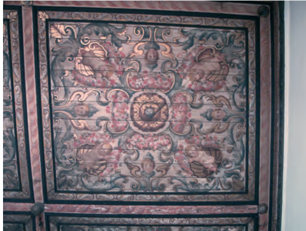
Foto 11 - Tecto em madeira pintado