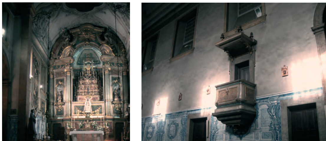
Foto 5 e Foto 6 - Interior do templo