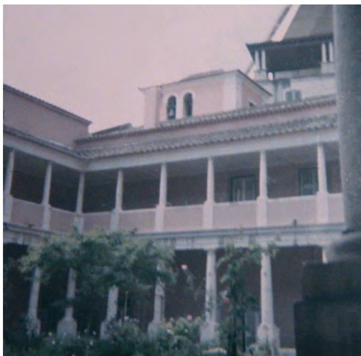
Foto 15 - Pormenores do Claustro

O claustro é um admirável elemento arquitectónico Maneirista com excelentes exemplos azulejares. Possui dois pisos, em que o primeiro é de maior altura, com colunas toscanas que assentam em plintos, unidos por pequenos muros, com panos de azulejos azuis e brancos de padrão do séc. XVII, colocados, no primeiro piso, no lado exterior e interior e só no interior, no segundo piso, com decoração floral. O centro do claustro possui um pequeno jardim, com fonte central oitavada, de mármore.