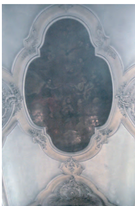
Foto 7 - Tecto pintado com a Coroação da Virgem

As paredes são recobertas de azulejos que narram as vicissitudes passadas pelas religiosas flamengas aquando da sua fuga.