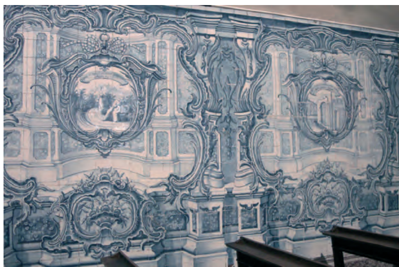
Foto 8 - Azulejos na nave da igreja

As paredes são recobertas de azulejos que narram as vicissitudes passadas pelas religiosas flamengas aquando da sua fuga.