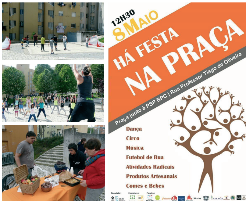
Ilustração 1. Imagens dos eventos comunitários 'Há festa na praça' 38

Num 2 a momento, cuja concretização e consolidação ainda decorre, procede-se à requalificação do espaço público, recriando a 'praça Futrua' à Rua Piteira Santos na praça comunitária de todos, através da construção de um campo sociodesportivo polivalente/feira/palco, para a prática de múltiplas atividades como, por exemplo, futebol de rua, basquete, vôlei, ténis, capoeira, dança hip hop , tiro com arco, atividades radicais, taekwondo , ginástica de manutenção, feira de produtos hortícolas e artesanato, palco de espetáculos musicais e teatrais, zona de sociabilidade e de realização de eventos comunitários de base informal, etc. A estrutura atualmente em construção é constituída pelas seguintes áreas funcionais: