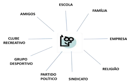
Gráfico 2 - Processo Socialização 27

Para Durkheim, o facto social, caracterizado pela sua exterioridade em relação ao indivíduo, consiste em “[...] toda a maneira de fazer, fixada ou não, suscetível de exercer sobre o indivíduo uma coerção exterior; ou ainda, toda a maneira de fazer que é geral na