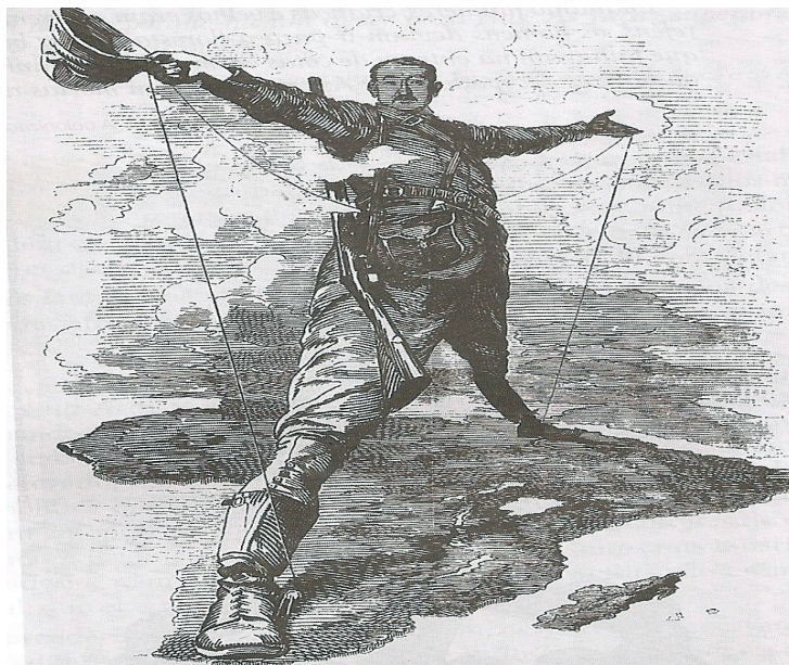
Cecil Rhodes propôs aos Ingleses a construção de uma linha férrea do cabo até ao Cairo(territórios Ingleses), em 1890. Mas como entrave tinham os territórios que pertenciam a Portugal (Angola e Moçambique).

Depois da Conferência de Berlim, o continente africano ficou entre o adormecimento e o arranque para a sua vida adulta pois para além de colonizado essencialmente por França, Reino Unido da Grã-Bretanha, Portugal e Bélgica, viu um mundo mergulhado em conflitos como a Primeira Guerra Mundial ocorrida entre 28 de Julho de 1914 a 11 de Novembro de 1918, os “Loucos” anos 1920 marcados pela abundância de dinheiro nas “novas” sociedades capitalistas e o nascimento de novos estilos de vida, o “Crash” da Bolsa de Wall Street ou “Quinta feira negra” o fatídico 24 de Outubro de 1929 que marcou a maior perda de sempre dos mercados bolsistas Norte-americanos causando a “Grande depressão”, África esteve sempre adormecida perante o “New Deal” e o nascimento dos regimes totalitários que levaram à Segunda Guerra Mundial ocorrida entre 1939 e 1945.