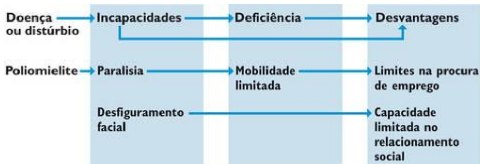
Figura 2: Modelo de classificação da CIDID.