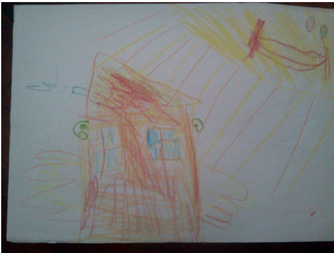
Ilustração 7 - A casa com asas