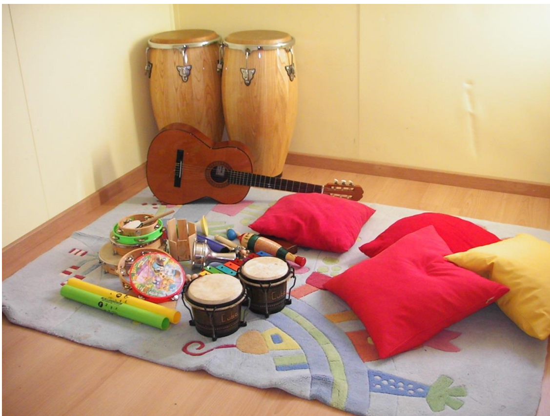
Ilustração 4 - Sala de Musicoterapia