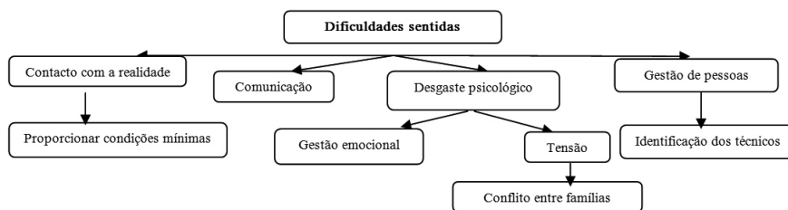
Esquema 2: Dificuldades do profissional de Serviço Social